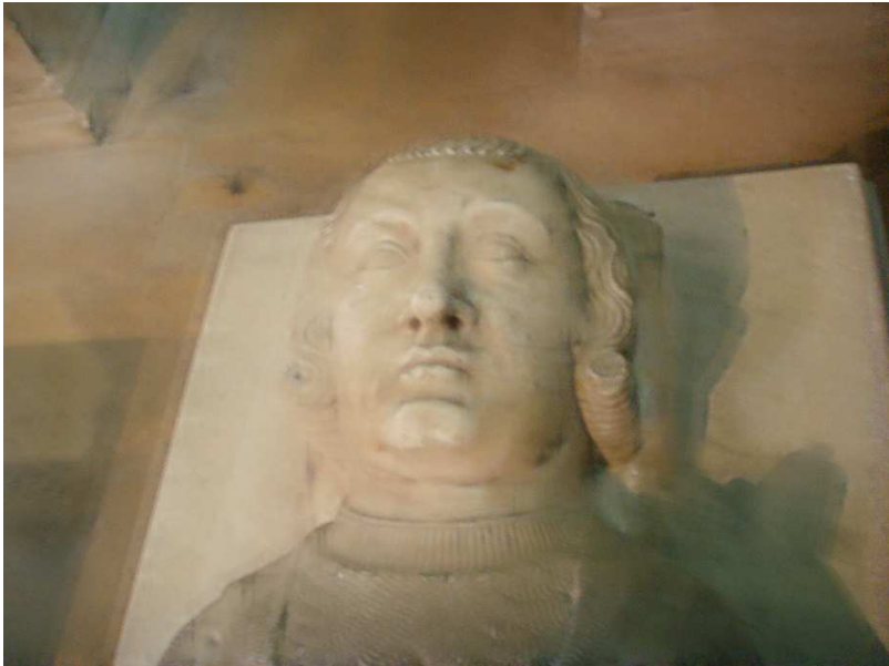
Abb. 9: Kopf der Statue von Karl I. von Valois in St. Denis (Grab)

Diese Statue von Karl I. von Valois (1270-1325) paßt ausgezeichnet zu den Carolus-Münzen: