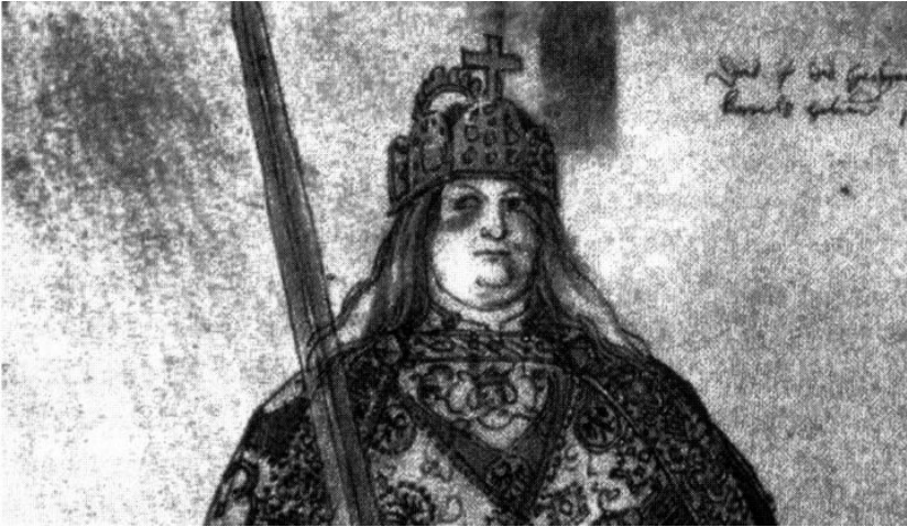
Abb. 11: Karl der Große von Albrecht Dürer (1510). Dieses Bild unterscheidet sich noch von späteren Phantasie- und Idealbildern, entspricht aber perfekt den Porträts auf den Münzen, die Karl dem Großen zugeschrieben werden, sowie der Statue von Karl von Valois