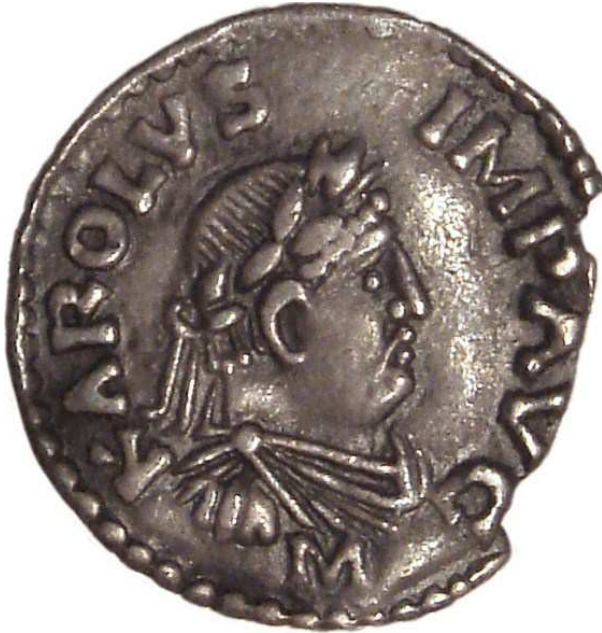
Abb. 10: Silber-Denier, Abbildung von KAROLUS IMP AVG (Karl dem Großen zugeschrieben)